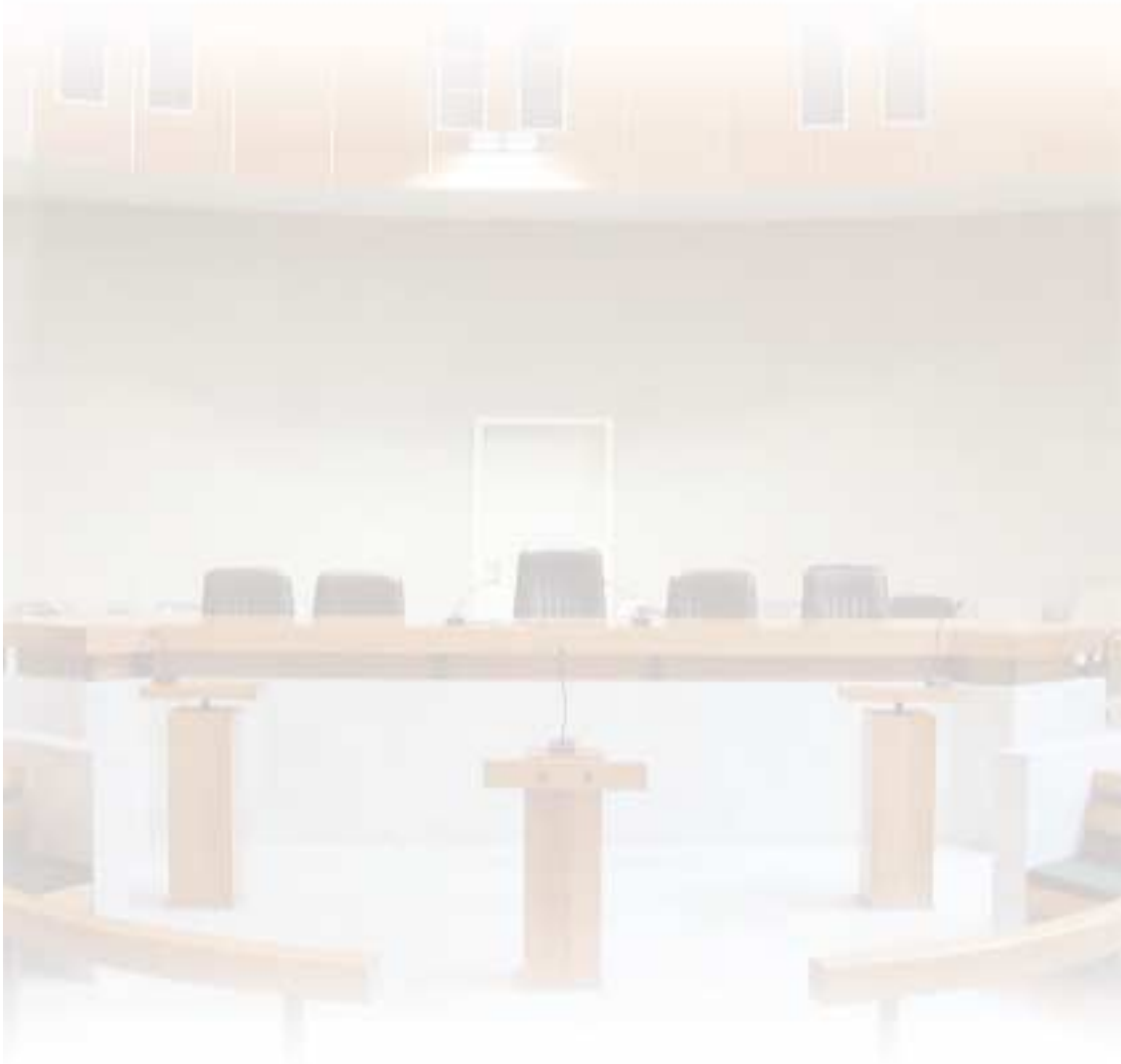
Direction des affaires criminelles et des grâces Bureau de la justice pénale de proximité, des politiques partenariales, et des alternatives aux poursuites et à l'emprisonnement