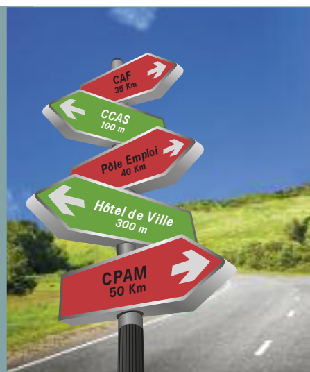
Couverture : © Montage illustrations : pict rider • tarasov_v/Fotolia

L'accès aux droits et aux services sociaux est un enjeu qui interroge les élus alors qu'on observe un recul progressif des permanences de certains organismes dans les communes.